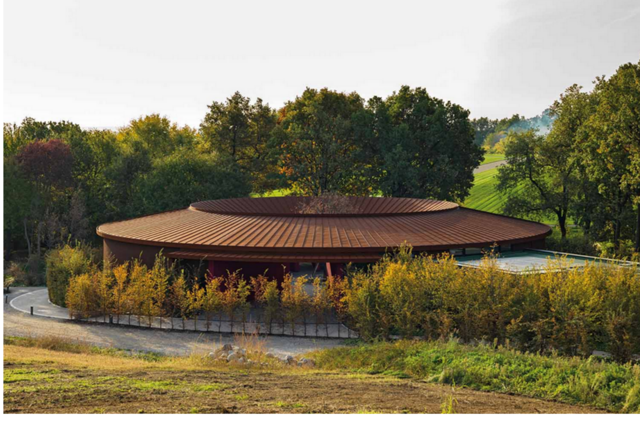
Scritto da Redazione The Plan - 3 Ottobre 2022

È dalle forme di un nautilus marino che ha preso spunto il disegno e il progetto della nuova reception della cantina vitivinicola Ca' del Bosco di Erbusco, in Franciacorta , un luogo votato all'accoglienza e, proprio per questo, realizzato in forma circolare. Progettata dall'architetto Gabriele Falconi per FALCONI architettura , è una struttura ricettiva immersa nella natura, quasi puntiforme grazie alla sua immagine rarefatta, leggera e caratterizzata da un'alternanza di pieni e vuoti che garantiscono una costante connessione con il contesto. Se, da una parte, è lo specchio di quell'indissolubile legame tra arte e vino caro alla tenuta, dall'altro, la reception dalle reminiscenze classiche è anche simbolo di due valori altrettanto fondanti: il rispetto e la centralità della natura , che ingloba e nasconde quasi interamente l'edificio stesso allo sguardo del visitatore. La natura, infatti, oltre a entrare al suo interno grazie al gioco di trasparenze delle vetrate e ai passaggi lasciati aperti nella struttura, è protagonista grazie alla quercia al centro della corte interna, il nocciolo vero e proprio dell'abbraccio della natura e delle persone. Rispetto dell'ambiente e dell'habitat naturale delle piante, centralità fisica e valoriale. Ma la natura, attraverso il legno, è presente anche nella struttura realizzata da LignoAlp .